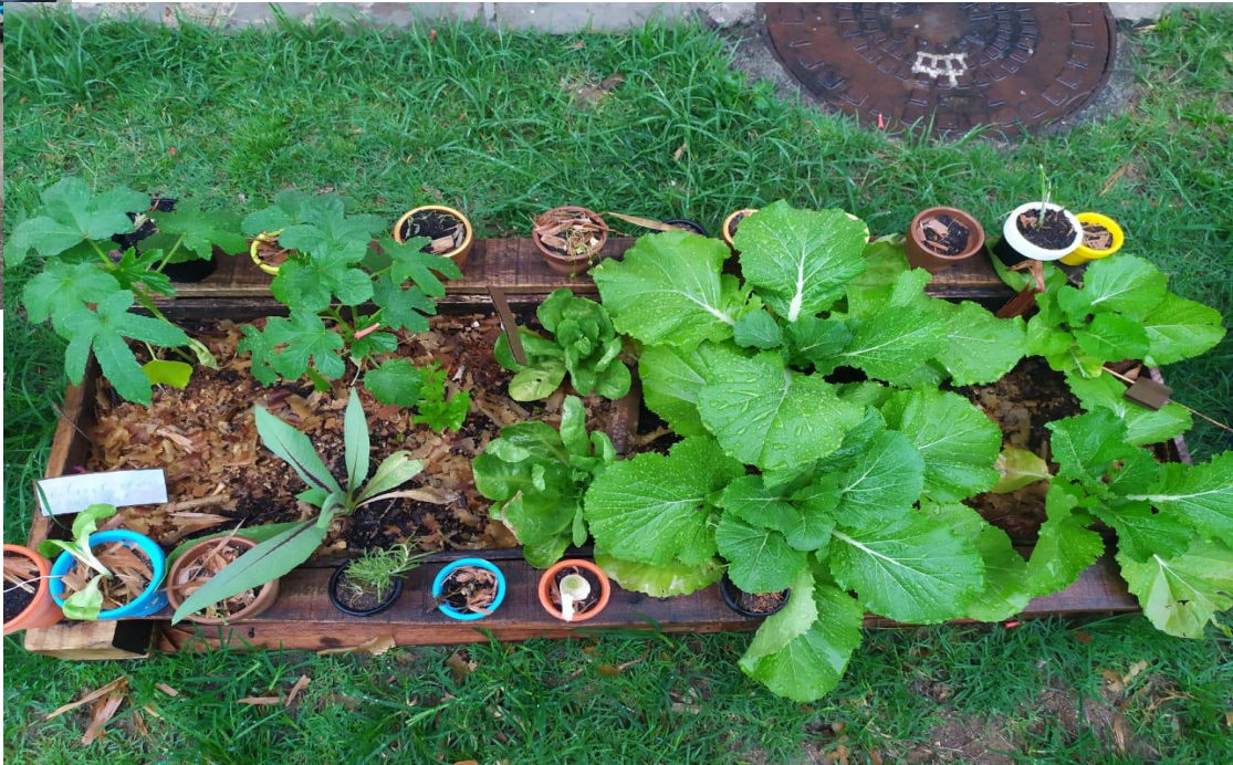
Legenda: Fotografias do Plantio realizado pelo Projeto Semando - EPSJV